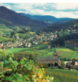
Zwischen dem Gold der Weinberge liegt Waldulm