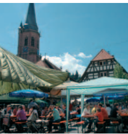
Zahlreiche Feste auf dem Marktplatz