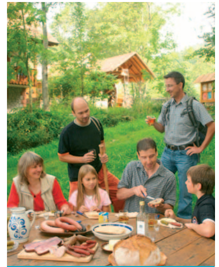
SEEBACH | MUMMELSEE

Dans les fermes, nombreux sont les animaux qui attendent les caresses de petits compagnons de jeux. Des aires de jeux, un programme d'activités pour enfants, des excursions, des jardins d'aventures, tout ce que les enfants adorent.