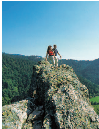
OTTENHÖFEN IM SCHWARZWALD

Waldulm n'est situé qu'à deux pas de Kappelrodeck. Un village du « vin rouge » des plus charmants. Là où le temps semble s'être arrêté, là où le quotidien des viticulteurs est omniprésent. Là où les colombages et les décorations florales rivalisent de bonne humeur, où l'odeur du pain frais sortant des fenêtres vient caresser vos narines. C'est une invitation à découvrir la région, profitez donc de chaque jour de vacances bien méritées. Kappelrodeck et Waldulm sont des villégiatures de paradis, idéales pour les familles et les vacanciers qui préfèrent les balades, les randonnées et les sorties en bicyclette à la conquête des montagnes, le tout au calme.