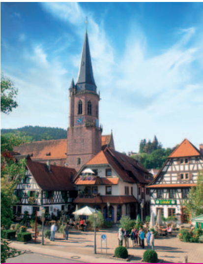
KAPPELRODECK | WALDULM