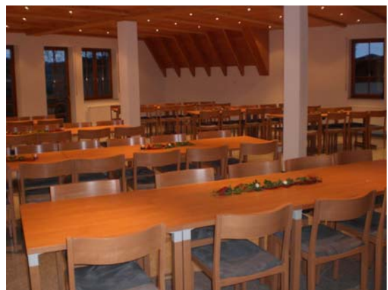
„Im kleinen Benjamin“ (ca. 80 Pers.)

Fon: 0 78 42/81 56 Fax: 0 78 42/9 84 22 Mail: info@lettner-kappelrodeck.de