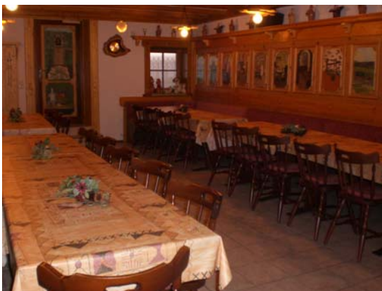
„Zur Fassdaube“ (ca. 45 Pers.)